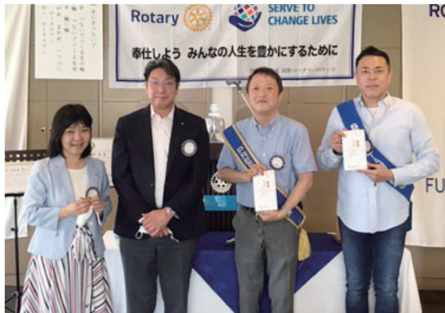
新旧役員バッチ交換