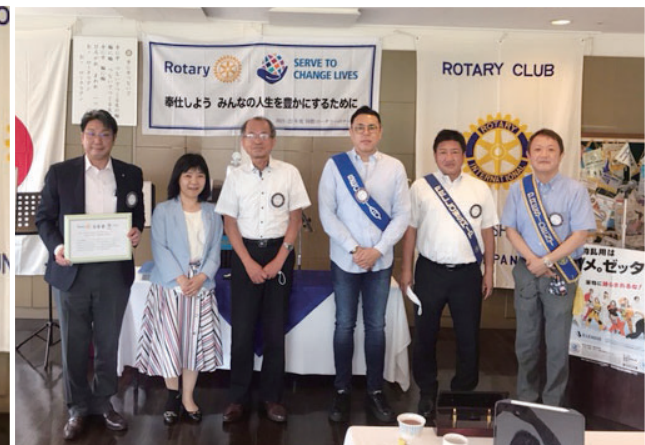
次年度役員宣誓式